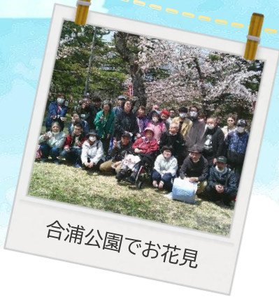
合浦公園でお花見