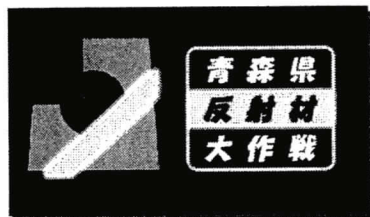
青森県反射材大作戦ロゴマーク