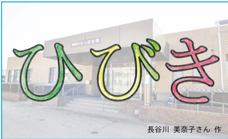
長谷川 美奈子さん 作